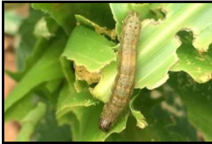
Fall Army Worm in Maize