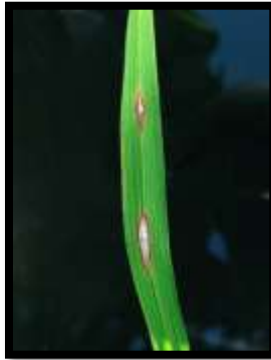
వరిలో అగ్గి తెగులు