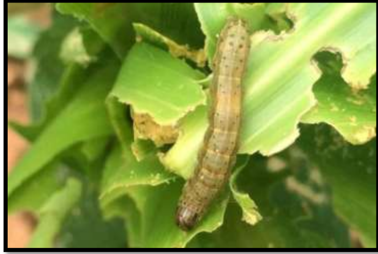
మొక్కజొన్నలో కత్తెర పురుగు